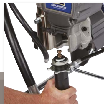
2. ÅPNE DØREN OG FJERN PUMPEN