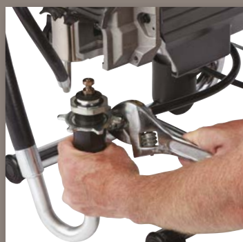
3. KOBLE FRA SLANGENE