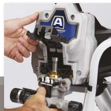
2. FJERN PUMPEHUSET