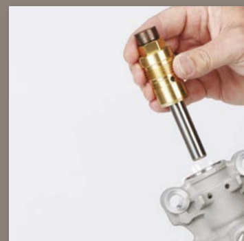
4. INSTALLER DEN NYE PUMPEN OG MONTER PUMPEHUSET