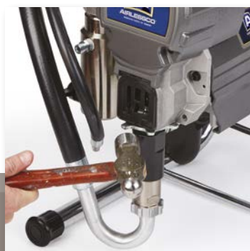
1. LØSNE LÅSEMUTTEREN

Airlessco opprettholder produktiviteten med Quick Repair pumpesystem. Reduser dødtid og skift ut pumpen på stedet – uten noen spesielle typer verktøy!