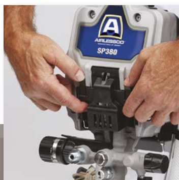
1. SKYV OPP DEKSELET