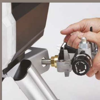
3. BRUK RAMMEN TIL Å FJERNE PATRONEN